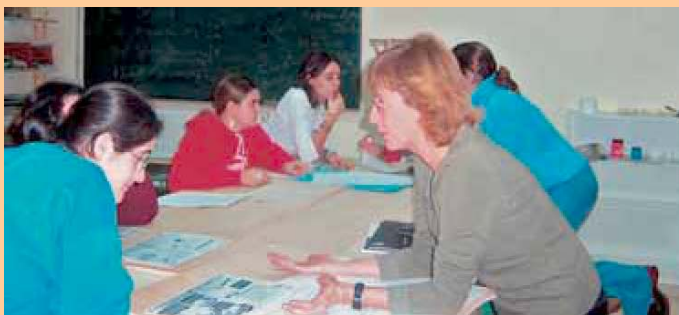
С образователни програми децата и възрастните...