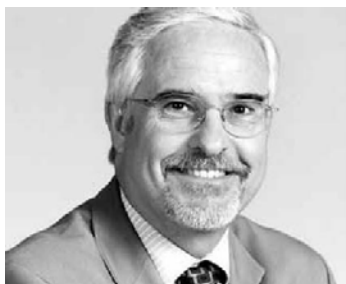
Бернар Херодин Президент на PRO EUROPE