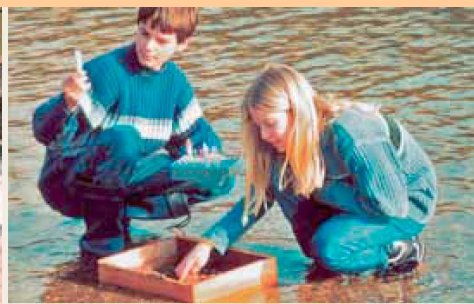
Насърчаване на екологично съзнание испанският “Влак на околната среда”...