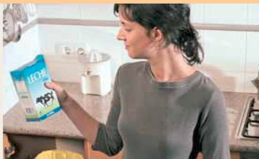
...научавата за необходимостта от сортиране, рециклиране и повторно използване на опаковките и отпадъците от опаковки.

периода между 1997 г. и 2001 г., делът на рециклираните и оползотворените опаковки нарасна от 31 милиона тона (53%) на 39 милиона тона (60%). Това опазва природните ресурси, намалява емисиите на CO 2 и редуцира изискуемия капацитет на сметищата. 9