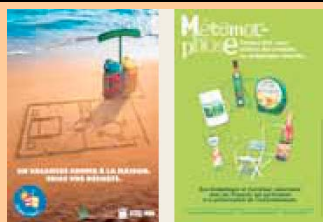
Във Франция бяха осъществени няколко кампании съвместно с общини, като “Правилна ваканция”, или заедно с търговски вериги, като “Метаморфози”.

Във Франция, Eco-Emballages разработи промоции върху опаковките, главно за деца, в сътрудничество с търговските вериги и производителите на опаковани стоки. Опаковките на различни продукти, като бисквити, кисело мляко или зърнени храни например, бяха украсени с карикатури на екологични теми и потребителите имаха възможност да поръчат “Природна викторина” (Natur’Quiz). Викторината е нещо като “Обикновена надпревара TM ” (Trivial Pursuit TM ) с въпроси по околна среда.